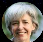
Claudie Haigneré Spationaute