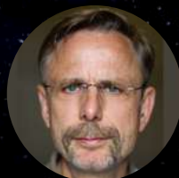
Christophe Rossignon Producteur du film