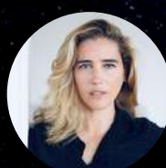
Vahina Giocante Comédienne