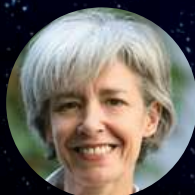
Claudie Haigneré Spationaute