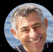
François Sarano Océanographe