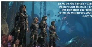
Le jeu de rôle français « Clair Obscur : Expédition 33 » est très bien placé pour rattraper le titre du meilleur jeu 2025.

À l'approche de Noël, Big N a enrichi l'offre avec des jeux comme le remaster des deux Mario Galaxy, un Kirby Air Ride qui se parcourt sur des pistes atypiques, Hyrule Warriors : Les Chroniques du sceau qui plaira aux adeptes de jeux de combat à grande échelle, ou encore Légendes Pokémon : Z-A... avant de